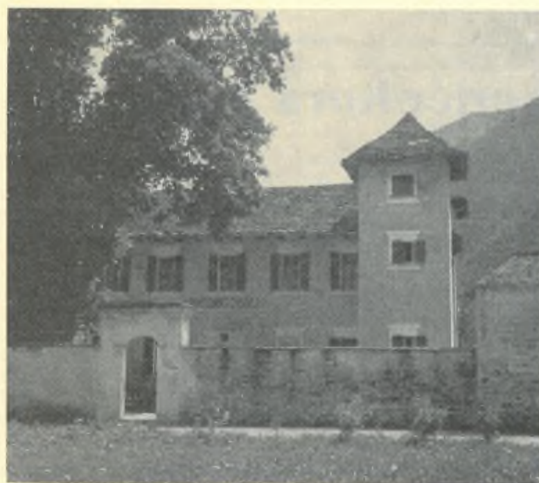
L'ex castello dei Marcacci a Brione

Ai tempi della Elvetica unitaria (imposta dai Francesi sull'esempio della Francia) lo troviamo eletto nella Dieta cantonale del 1799 e,