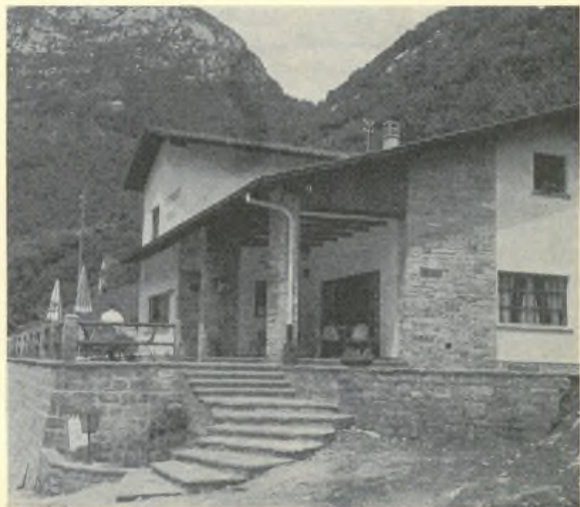
Il nuovo ristorante POSSE a Lavertezzo