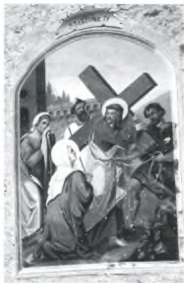
3. La stazione della Via Crucis a Frasco

Dipinto composto da varie scene. La principale raffigura il Cristo morto in grembo alla Madonna addolorata. In alto a sin. la scena di una persona caduta falciando fieno di bosco, ma salvatasi come attesta la scritta GR (Grazia Ricevuta). Ai lati del Cristo morto ci sono i santi Giuseppe (a sin.) e Giovanni Evangelista (a destra). In basso le anime purganti e un angelo che ne sta prendendo una per mano.