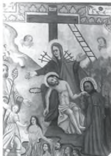
2. Deposizione - 1781 - Gerra Verzasca - Casa Pedroia - Pura. Restaurata da Silvio Baccaglio nel 1986. Autore prb. F. M. Rotanzi.

Dipinto composto da varie scene. La principale raffigura il Cristo morto in grembo alla Madonna addolorata. In alto a sin. la scena di una persona caduta falciando fieno di bosco, ma salvatasi come attesta la scritta GR (Grazia Ricevuta). Ai lati del Cristo morto ci sono i santi Giuseppe (a sin.) e Giovanni Evangelista (a destra). In basso le anime purganti e un angelo che ne sta prendendo una per mano.