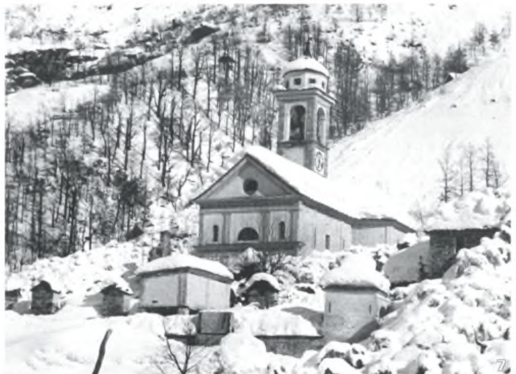
Frasco 1951: Le fotografie n° 1,3,4,5 e 7 sono di Eugenio Molinari e le due rimanenti sono: "Edizioni il Nido"