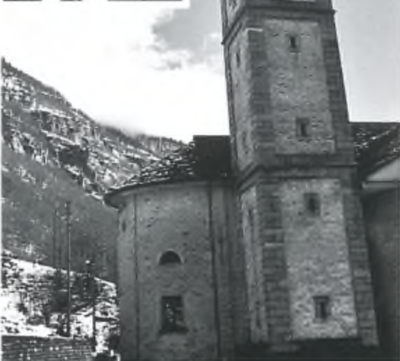
Frasco: Sul campanile c'è un segno che ricorda dove è giunta la neve in quel lontano febbraio.