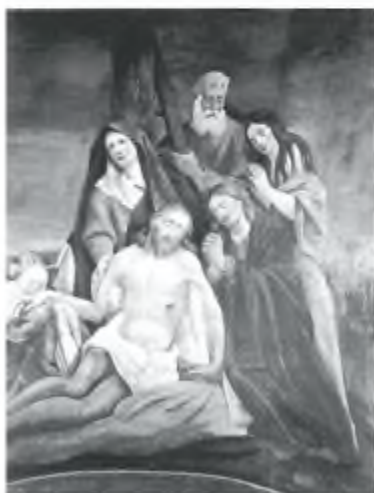
1. Deposizione. (Particolare) - 1879 - Cappella a Mergoscia. Autore G. A. Vanoni. Restaurata da G. Grimbühler nel 1993.

Sono numerosi i dipinti che illustrano gli avvenimenti che i cristiani ricordano in questo periodo: la passione e la morte di Gesù Cristo.