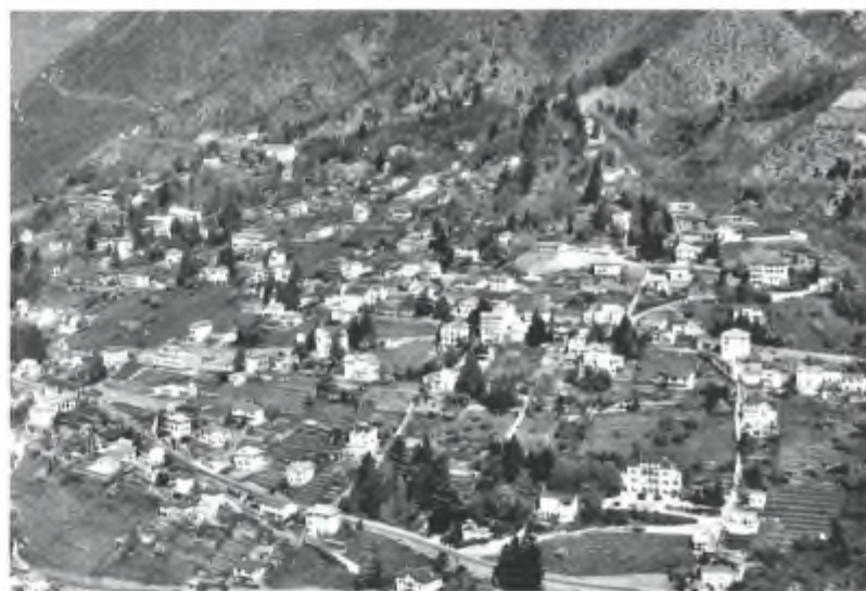
Locarno Monti, tanti anni fa

mente dimostrato di saper fare nella sua breve esistenza, una figura di spicco del giornalismo ticinese. E proprio per questo, oltre che per la sua umanità, la sua intelligenza e il suo equilibrio è certo che il ricordo non verrà mai meno".