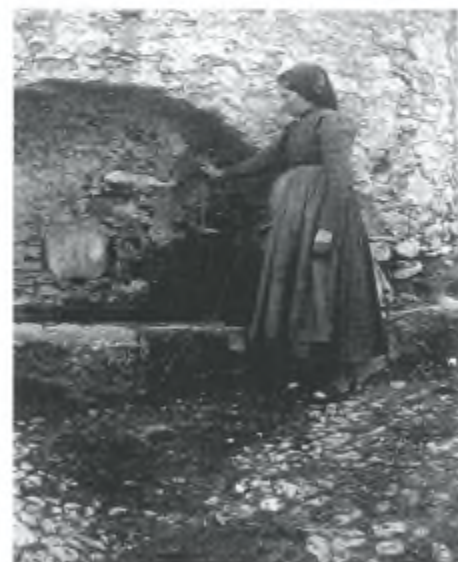
Una vecchia fontana ai Monti scomparsa parecchi anni or sono