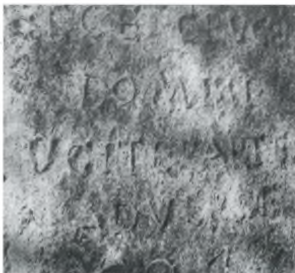
Sul sagrato della chiesa di S. Bartolomeo di Vogorno una grossa pietra del '700 aspetta un nuovo posto

Un blocco di granito del tutto particolare, settecentesco, si trova da tempo sul sagrato della chiesa di San Bartolomeo a Vogorno assieme alle lastre che coprivano il pavimento del porticato - vedi foto con la bimba che custodisce il suo cagnolino - .