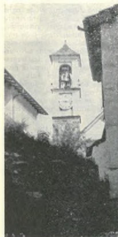
(La chiesa di Gerra Verzasca)

vi si collocò nel 1839, la terza nel 1860.