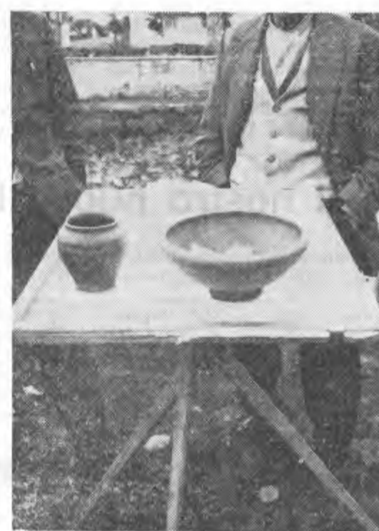
Vaso e ciotola intatti.