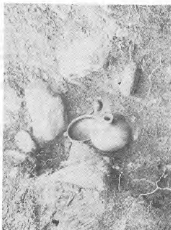
Da sin. a destra: La tomba coperta; la tomba scoperta e la anfora con la ciotola.