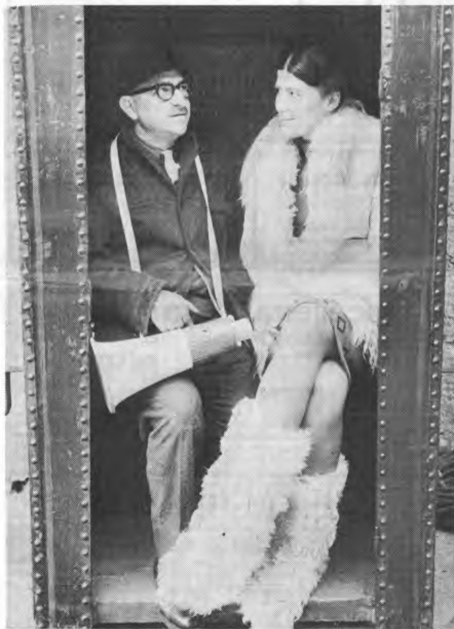
Venga a prendere il caffè da noi, è il titolo di un importante film che si sta girando sulle rive del Lago Maggiore e nei pressi di Lui-

no. La regia è di A. Lattuada che si avvale della collaborazione di F. R. Colluzzi (nella foto) e del noto attore Ugo Tognazzi.