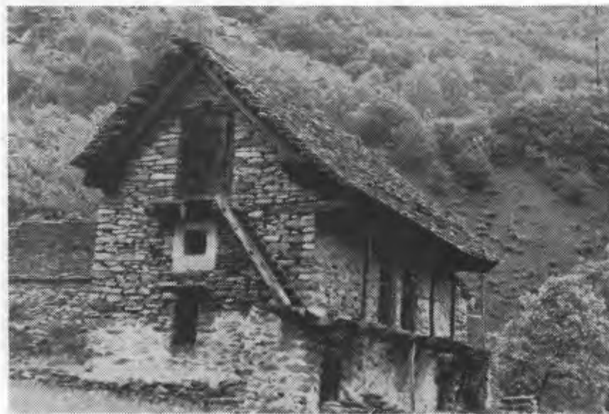
Una tipica casa, con la finestrella orlata di bianco e alcune pareti a muro a secco nella frazione di «Costaccio» a Gerra Verzasca.

molti forestieri passano un momento della loro vita su di essa, guardando il lago da una parte, e dall'altra il vuoto.