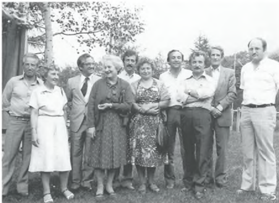
Foto ricordo del 50mo della "Pro Verzasca". Brione Verzasca - giugno 1983