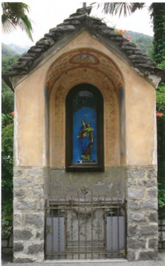
La Madonna agli antichi splendori.