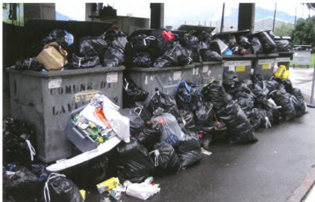
Tassa sul sacco? Sì grazie!

Le modalità di calcolo delle tariffe 2007 sono consultabili presso la Cancelleria del Comune durante gli orari d'apertura degli sportelli.