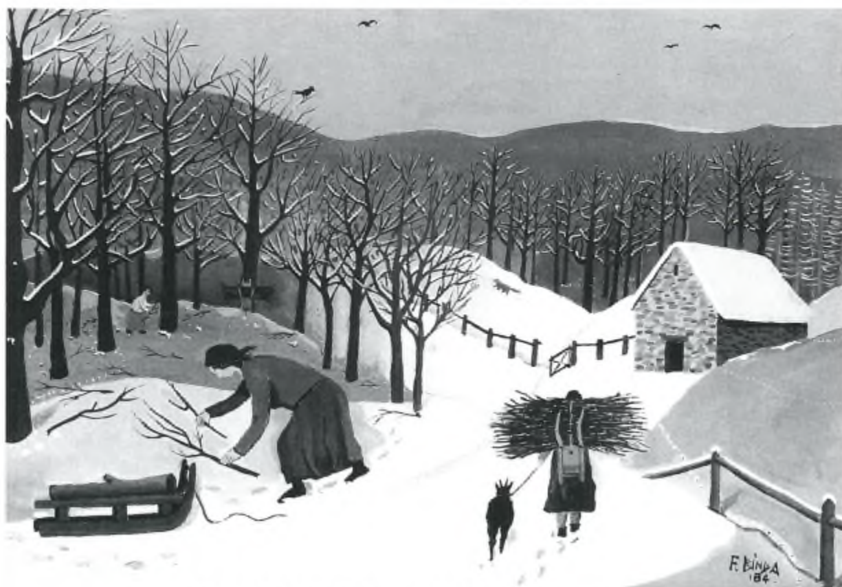
"A raccogliere legna in un mattino di vento" Olio di Franco Binda

Ai nostri fedeli lettori, ai collaboratori e agli inserzionisti Auguri di un Felice 2001