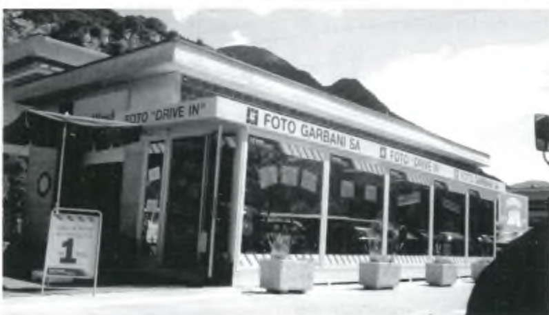
Il moderno negozio Foto Garbani Video SA a Riazzino