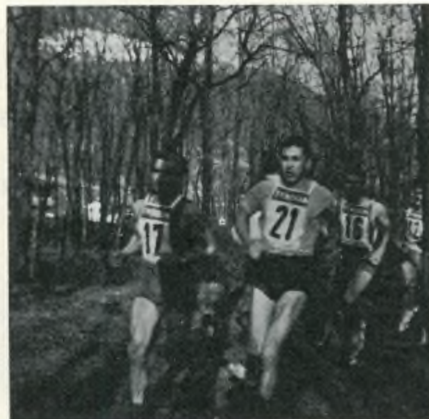
I pistaioli in piena azione