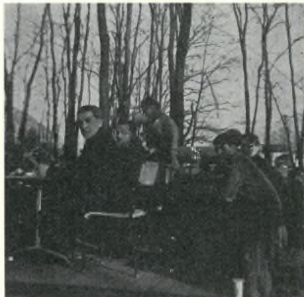
La giuria al lavoro.

Questa gara sarà patrocinata dal nostro giornale il quale intende così dare il suo piccolo contributo allo sviluppo dello sport locale.