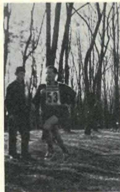
Gli intramontabili Rossi e Mossi