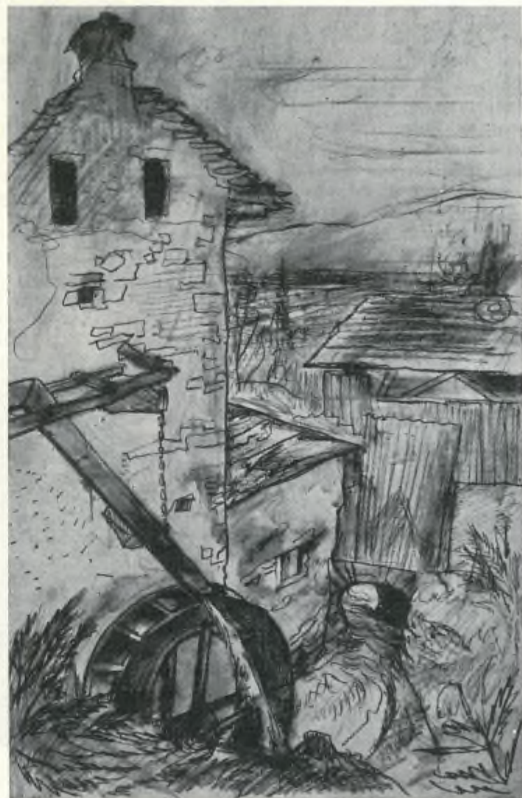
Lindi: Il vecchio mulino a Fontanedo, Gerra Piano