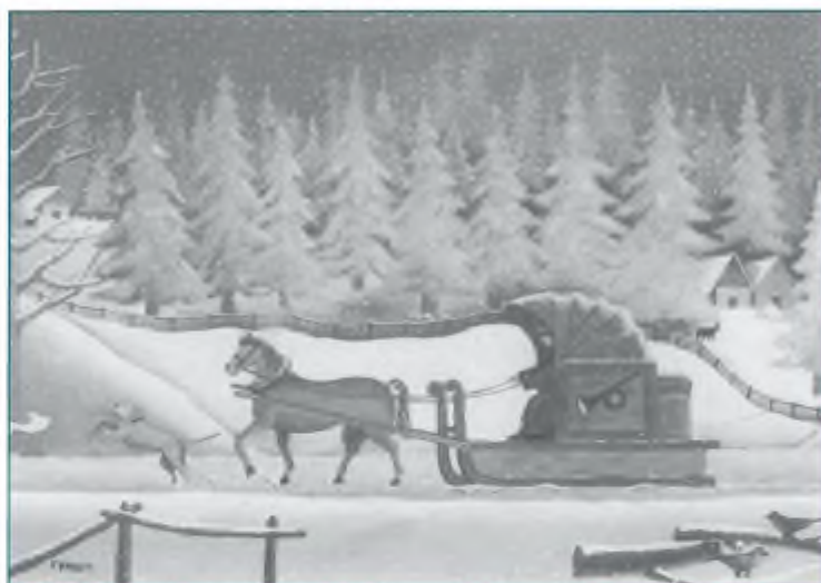
"Al trotto verso il nuovo anno" - Dipinto di Franco Binda

Auguri di Buone Feste agli abbonati ai nostri affezionati lettori ai collaboratori e agli inserzionisti