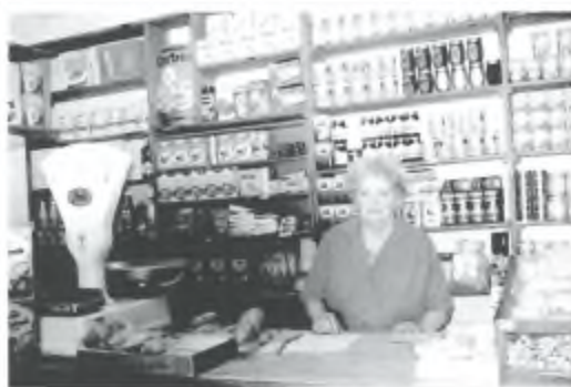
Sopra: Il negozio "Vis-a-vis" di Cugnasco (Estate 2000)