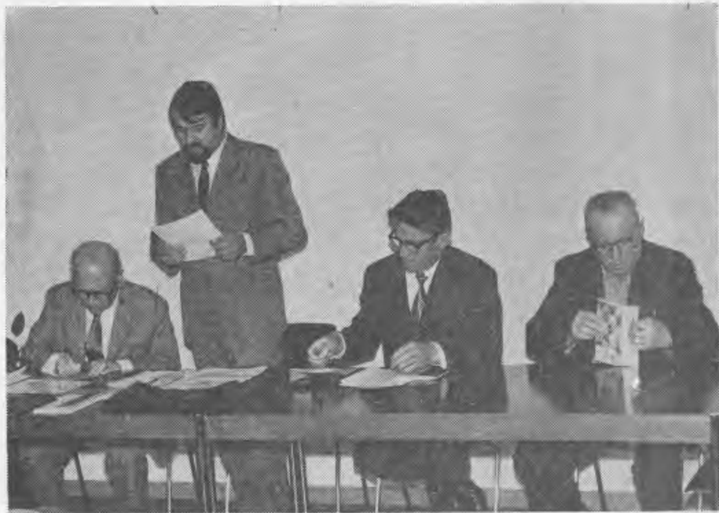
Discorso di apertura