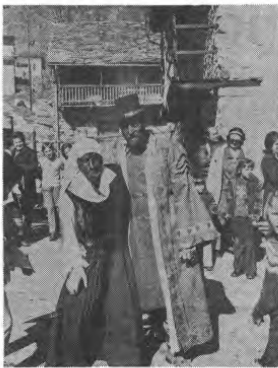
Re Taboi e la Regina