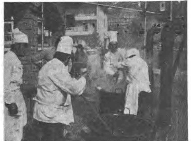
La valida squadra dei cuochi del Zeca al lavoro