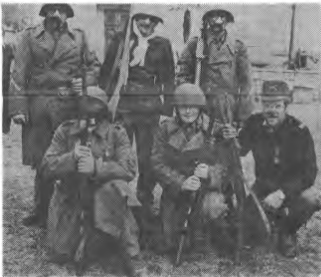
La compagnia d'onore di Sciavatt e gatt

Sonogno con il suo Re Taboi e Regina Taboiezza che noi però ci farebbe piacere vedere un po' più femminile, ha segnato il passo dei divertimenti prettamente nostrani ed allegri. Una grande folla ha acclamato gli organizzatori e il loro Re al quale si è poi accompagnato ricco fastoso e opulento, il grande ospite della giornata, Re Lipack venuto appositamente da Locarno con tanto di seguito. Un complimento a tutti, organizzatori e spettatori che hanno saputo trovare il giusto tono per passare una vera spensierata giornata.