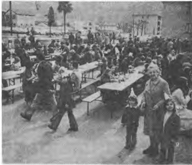
La mensa all'aperto a Gerra Piano

Per primo, ad aprire il festoso programma, è stato il carnevale di Gerra Piano, il riuscitissimo «Sciavatt e gatt», che ha visto una buona affluenza di pubblico e di maschere, specialmente da parte dei numerosi bambini. Buono ed apprezzato il risotto e le luganiche che poterono essere consumati sulla magnifica piazzetta antistante la chiesa tramite la gentile accondiscendenza di un sole splendido, bistrattato soltanto da qualche fredda folata di vento di marzo.