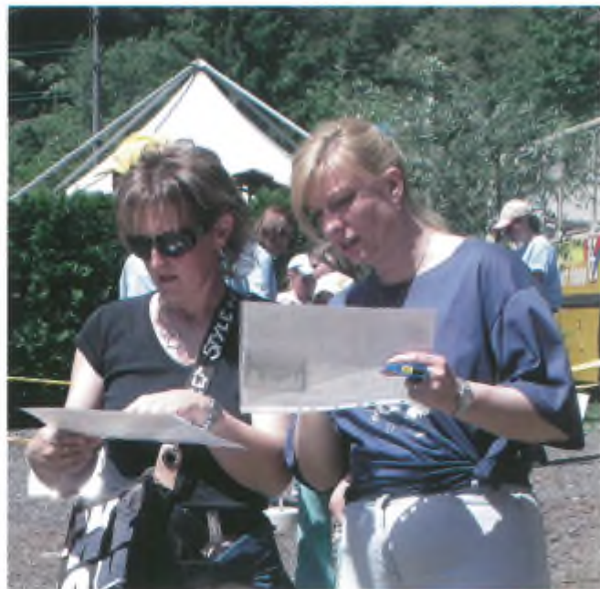
Dunque, fammi capire, dobbiamo prendere la prima a destra, poi dritti fino al secondo incrocio, poi...

gomma e che si porta infilato al dito. All'arrivo si mette il chip in una scatoletta collegata al computer e si hanno così tutti i tempi di gara e la classifica.