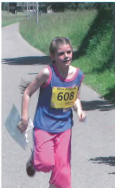
Forza Marica, ancora due punti e poi lo sprint finale..