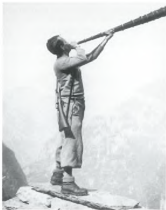
All'Alpe Bosco (estate 1936).