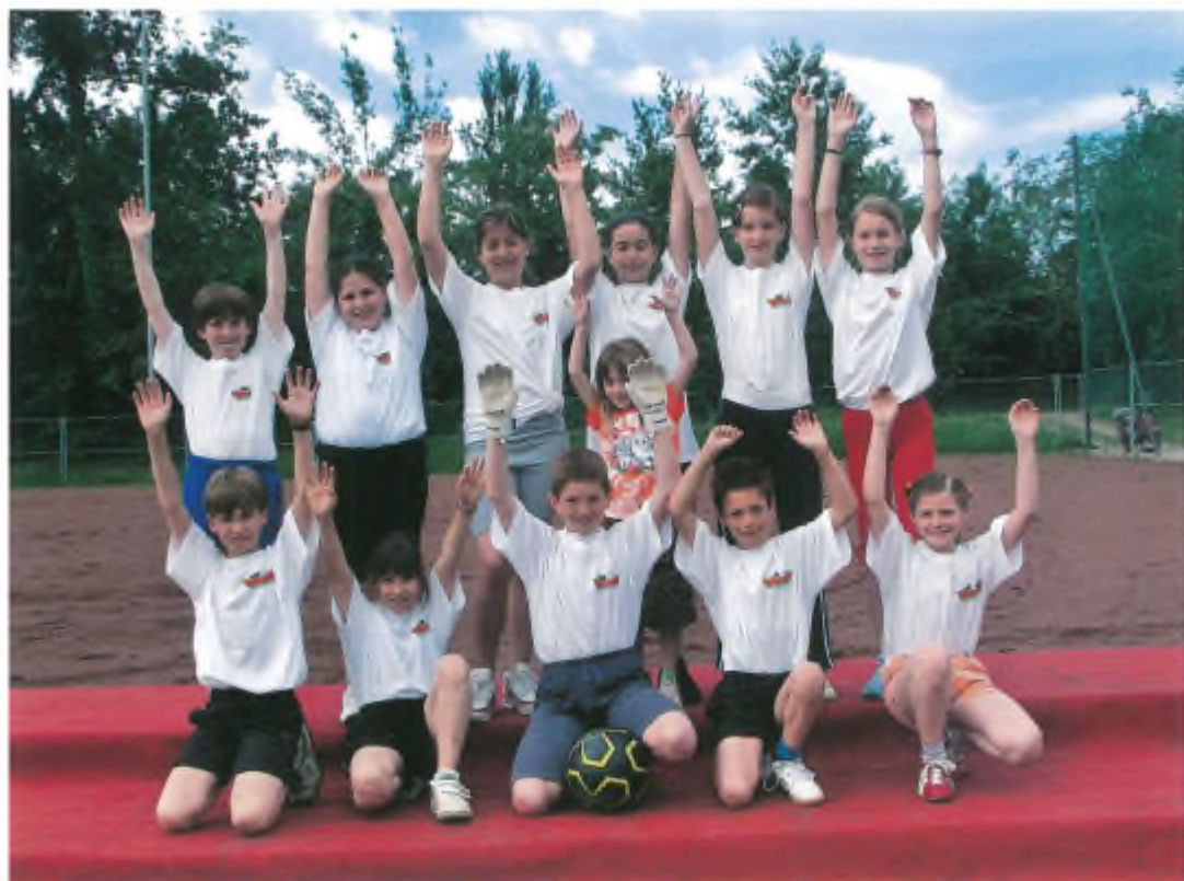
Squadra mista Lavertezzo Piano, classe 4 a -5 a .