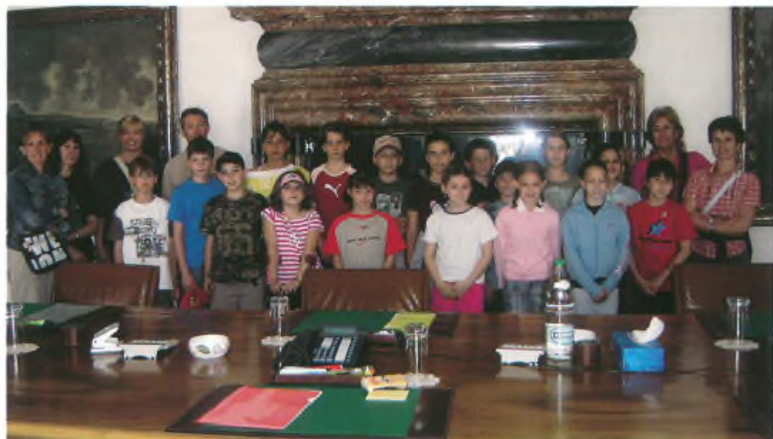
Gli allievi e i genitori nella sala del Consiglio di Stato.

Alla nostra guida abbiamo anche chiesto dove erano seduti quelli che si scambiavano le figurine dei mondiali invece di stare attenti e di lavorare. In seguito siamo andati a visitare la sala del Governo dove si riuniscono i cinque che abbiamo nominato prima. Qui si fanno delle riunioni segrete e sul tavolo c'è un pulsante per chiamare una segretaria nell'altro locale.