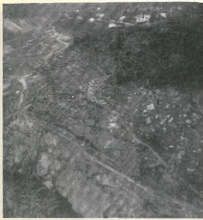
Dalla magra del lago riaffiora la vecchia strada della Valle stretta e tortuosa, ma pur ricca di tanti cari ricordi.

Il primato del numero di automezzi spetta al Circolo di Lugano (che nel contempo è circolo e comune, con 4'546 unità; seguono con oltre 3'000 Bellinzona, Vezia e Balerna; con oltre 2'000 Locarno, Pregassona e Isole (Brissago) con più di 1'000 Navegna, (comprendente, come tutti sanno: Brione S. M. Cugnasco, Gordola, Mergoscia, Minusio, Tenero-