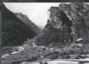
Arreio (cava) intorno al 1870