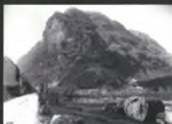
Arreio (cava) intorno al 1870 (Zappelli)

Nel corso del lavoro si parlerà spesso di «industria del granito». Occorre precisare che la locuzione, specialmente se riferita alla Verzasca, è parzialmente impropria: in Verzasca fu sì estratto del granito (specie agli albori dell'industria e quasi solo nelle cave della Molina del Cioppetta), ma generalmente e complessivamente si è estratto e esportato molto più gesso.