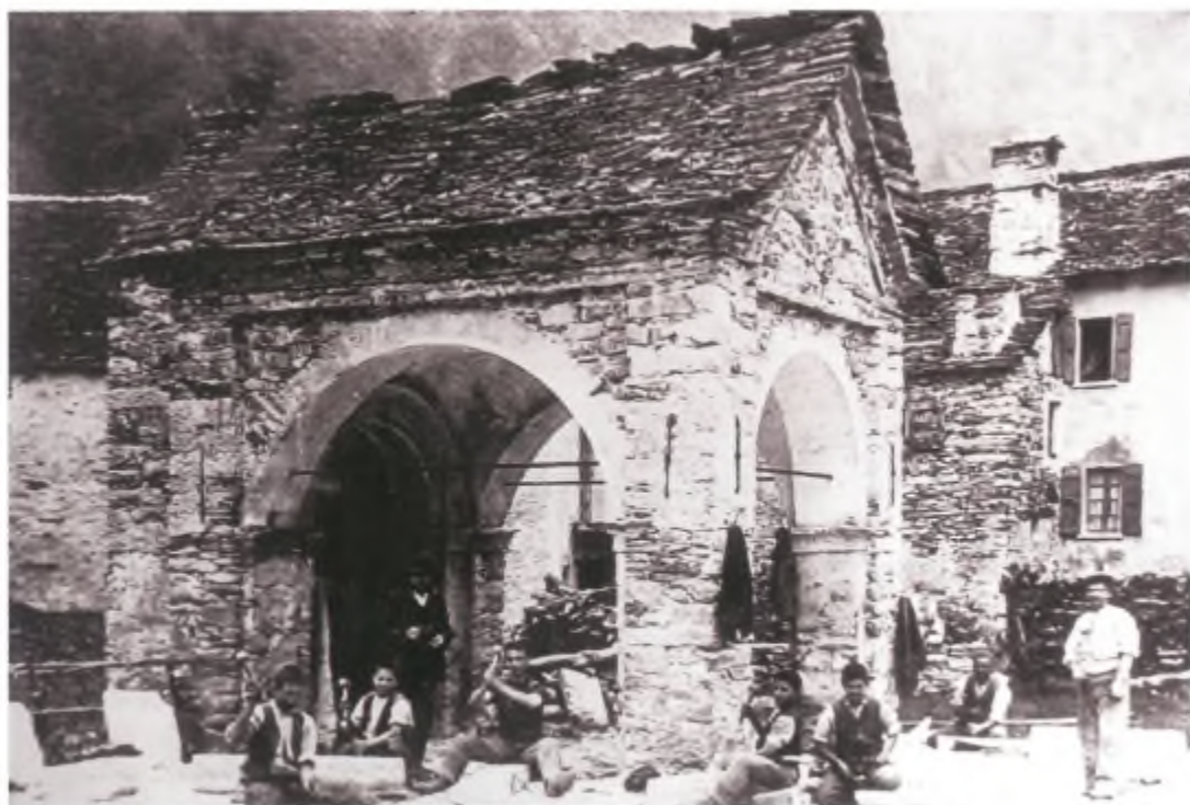
Scalpellini all'opera a Lavertezzo Valle (inizio secolo).

Caro padre, le lapidi del camposanto lasciano il ricordo, l'aveva picchiata già da ragazzo, ma era rimasta ferma sopra i "cürli", un giorno che si raggelò il sasso.