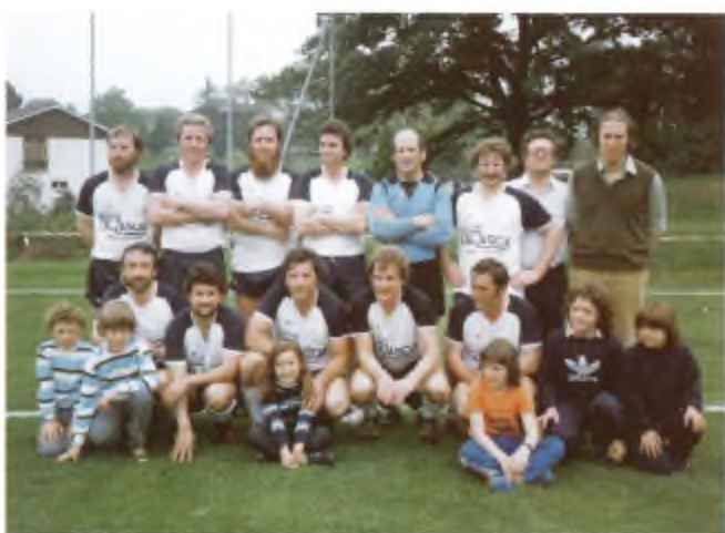
Squadra vittoriosa nel Campionato Veterani.