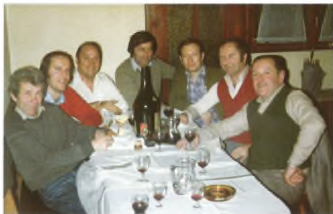
Cena di comitato del 1983