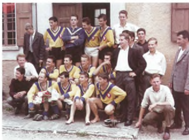
Anno 1963, Torneo a Brione Verzasca.