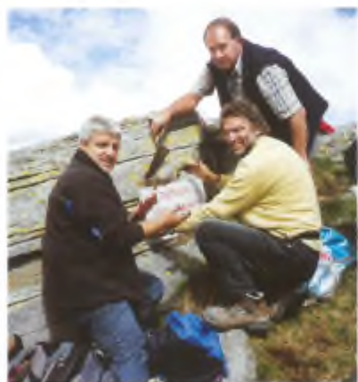
Posa della targa commemorativa.