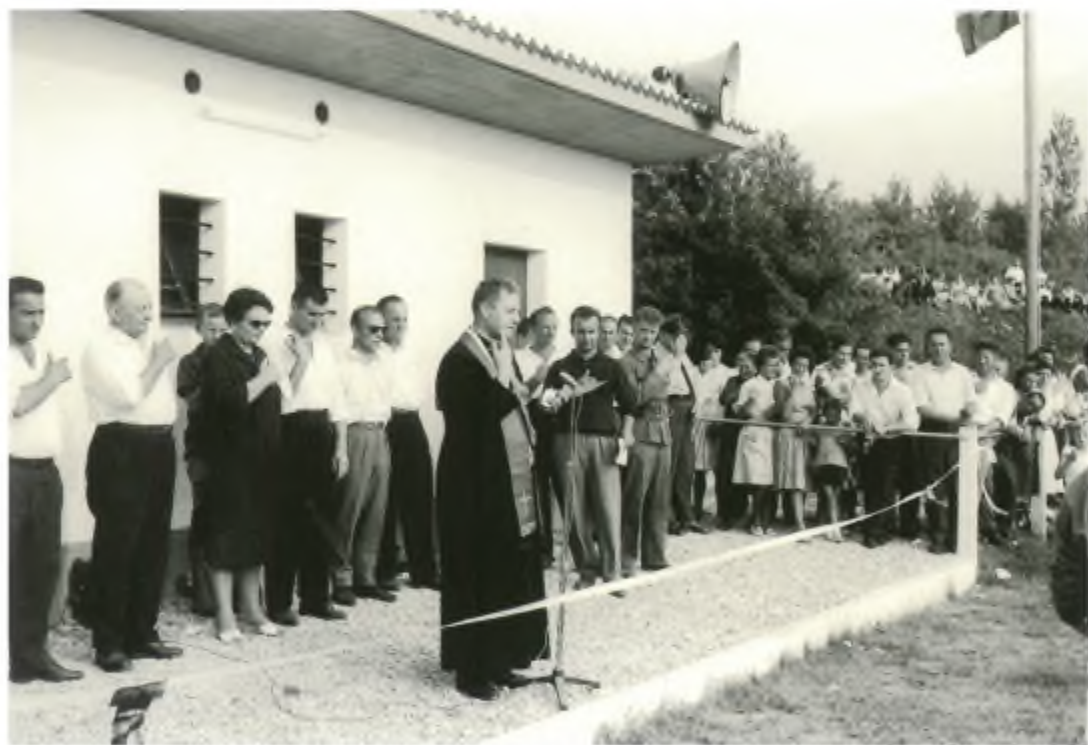
Inaugurazione del campo sportivo Al Porto (1962).

Per una panoramica attuale della struttura e del lavoro della società vi rimandiamo invece ad un'altra occasione.