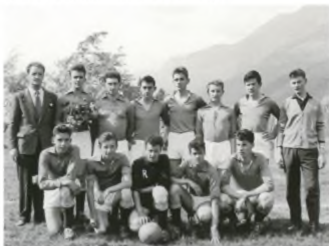
Anno 1960 ca.