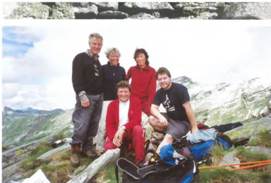
Alla traversata hanno partecipato anche molti escursionisti in forma non competitiva.

3h 25' 13", ideatore della corsa con Ean Barelli, (quest'ultimo ha raggiunto Lavertezzo in 3h 54' 45").