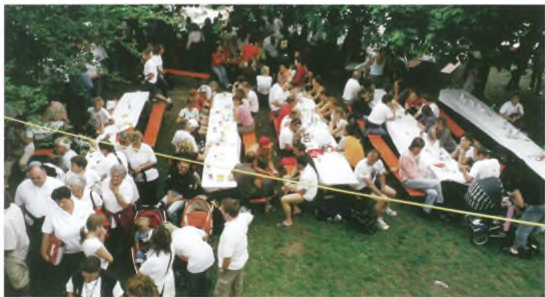
Il meritato riposo.