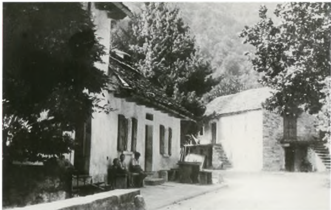
Aquign: er osteria. (Foto anni '30)

Giorni di iniziazione. O restavi te stesso o potevi incappare nel vortice, per esempio, degli "assetati". Si trattava di convivere con clienti troppo euforici e burloni. Inevitabile il giovanile ripudio... che poi si tramutò in sana compagnia. C'erano altri problemi a livello di paese, di valle, di cantone, da risolvere, uno sopra tutti, l'unione pacifica... e magari, tra tante divergenze, nasceva spontaneo un inno all'amore, una nenia, la voce dell'osteria.