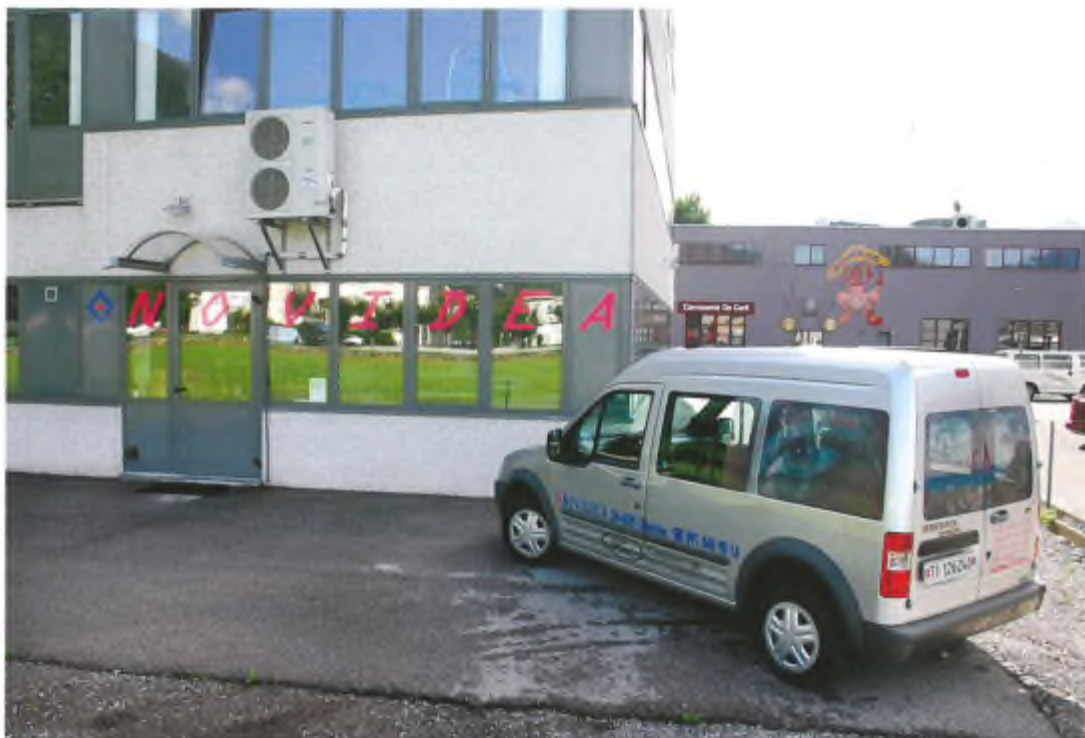
L'esterno della ditta situata al pianterreno dello Stabile Planet.