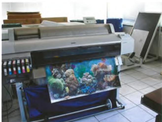
Poster a colori: nessun problema.

CTP Servizio Stampe digitali Cartelli Vetrine Striscioni Stampati Grafica Adesivi Mogliette