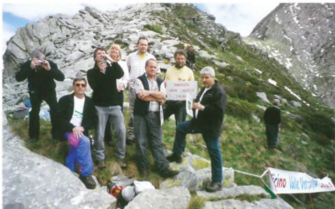
I rappresentanti dei Comuni di Lavertezzo e di Lodrino sulla Forcarella di Lodrino.

di Candido Scettrini