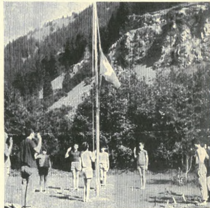
alza bandiera al Campo Elios

mento abbiamo potuto goderci le limpide acque del fiume antistante o la frescura dei pianori che le montagne intorno ci offrivano. Senza naturalmente badare ai voraci moscerini, o dar peso alle bizzarrie del fiume che a tratti si prendeva la libertà di modificare il proprio livello.