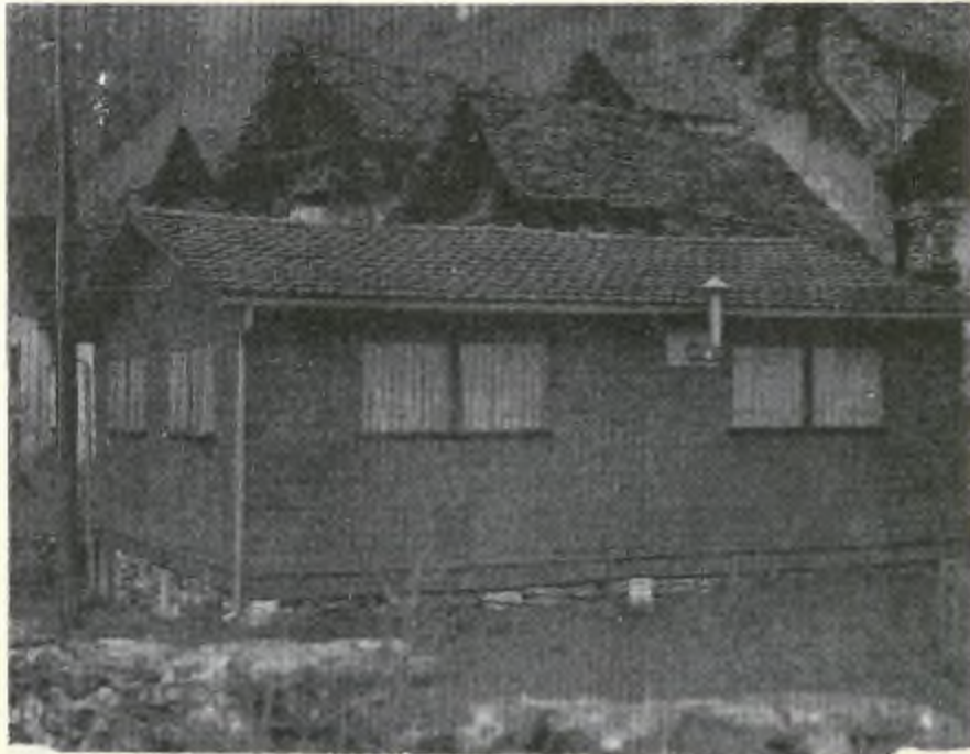
Il pugno nell'occhio

il grigio che possa entrare in considerazione. Negli agglomerati più recenti si possono usare anche altri colori, ma con prudenza, e sempre leggeri. Per le costruzioni che sorgono isolate il grigio è pure da consigliare in quanto deve fondersi con i colori dei sassi e delle rocce circostanti. Il bianco vivo nella maggior parte dei casi è da escludere. Sempre a proposito del colore ci pare che, con un po' di buona volontà, si potrebbero mimetizzare certi tetti già esistenti in cemento-amianto con una semplice colorazione ruvida in grigio-scuro.