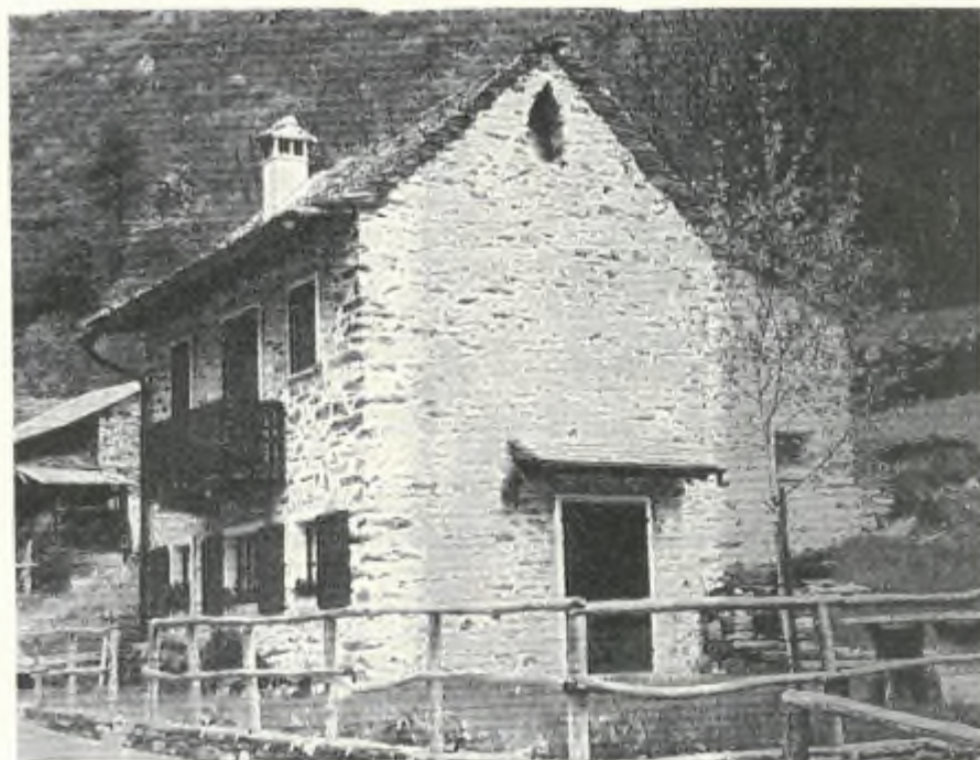
Tipica costruzione rispettante l'ambiente

del vestito fosse impeccabile. Non si tratterebbe soltanto di irriverenza verso il defunto e i suoi parenti ma altresì di una pedata data alle regole dell'eleganza. E' elegante colui che veste bene, naturalmente, ma senza dare nell'occhio, senza mettersi in eccessiva mostra.