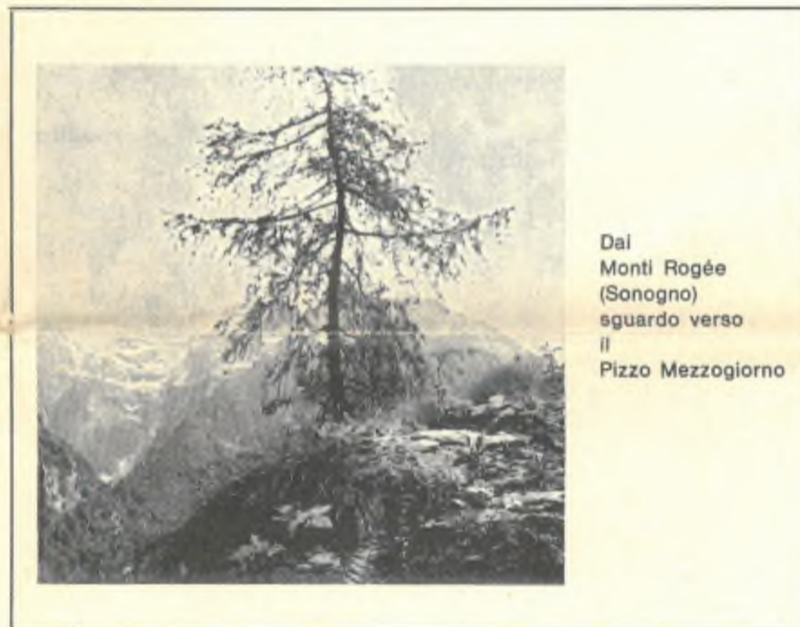
Dal Monti Rogée (Sonogno) sguardo verso il Pizzo Mezzogiorno

Si potrebbe continuare con le semplificazioni. Ma quanto detto fin qui è già sufficiente per concludere che gli scopi e quindi le mete di un moderno R. T. devono essere riveduti rispetto a quelli del passato e che, sempre, alla base, deve rimanere il sentimento di giustizia che deve prevalere sulle questioni tecniche.