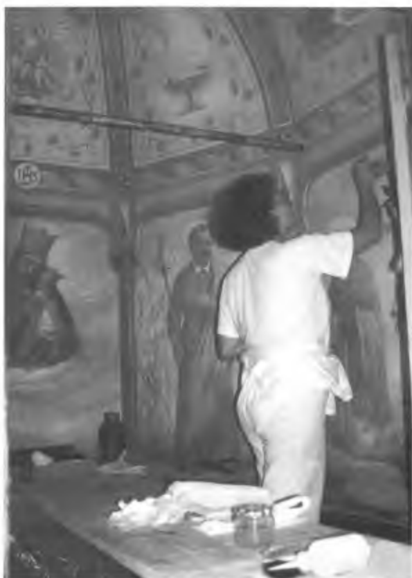
Lavertezzo. Durante i restauri.