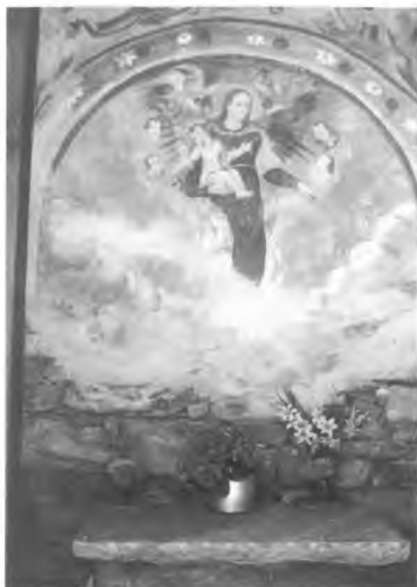
Gerra Verzasca, Madonna col Bambino. Cappella "Al Predell" (Foto 1998)