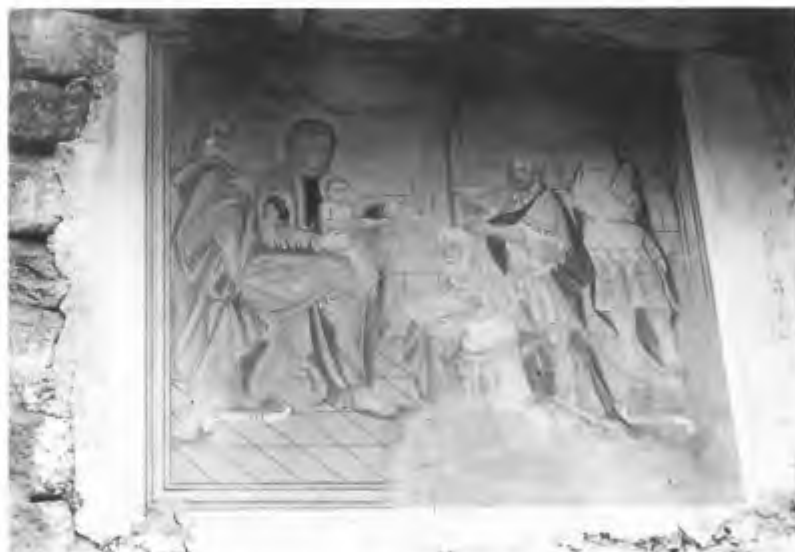
Brione Verzasca alla Motta. L'adorazione dei Magi. Grande affresco rivolto a Sud su un rustico.

Sulla manutenzione ordinaria abbiamo già detto in precedenza. Essa è compito dei proprietari. La Commissione cappelle è a disposizione per consigli, indirizzi di restauratori, ecc. L'attività della commissione è finanziata