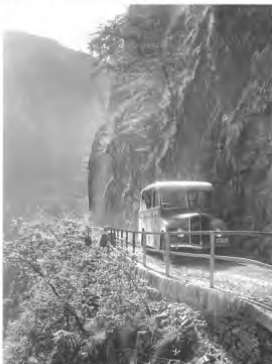
Quando circolavano questi autopostali i problemi di traffico erano di altra natura.

sti, prima che essi proseguano oltre; secondariamente mediante un'offerta mirata di posteggi combinata con un servizio di mini-bus, così da indurlo a cambiare mezzo di trasporto, specie nei fine-settimana del periodo estivo, quando si registrano le punte massime di affluenza. Ciò in alternativa ad un'impraticabile chiusura della Valle al traffico motorizzato individuale.