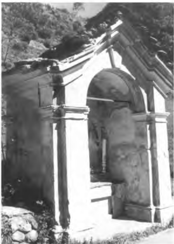
Lavertezzo. La cappella presso il Ponte dei Salti, che è stata trasportata per allargare la strada.