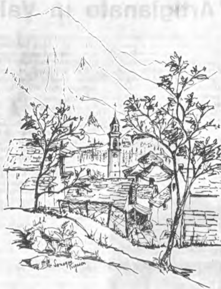
Un quadro poetico della Knobel: Sonogno il paese da lei preferito

Ha gi  esposto in diverse citt  della Svizzera tedesca e nel Ticino (ad Ascona presso la 3A e alla Ta-