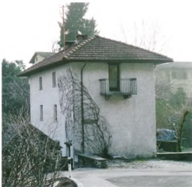
Casa Bartolomeo.

questa era attraversata da una carrale che si congiungeva con Piandesso attraverso un ponte di ferro a monte dell'attuale, travolto poi dalla buzza del 1948.