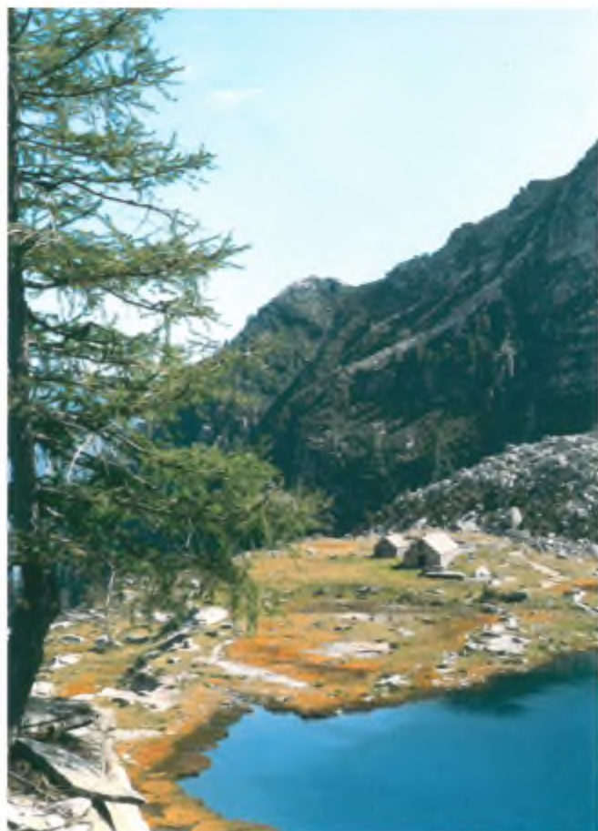
La Valle Verzasca è molto avara per quantità di laghetti alpini, ma non certo per bellezza.