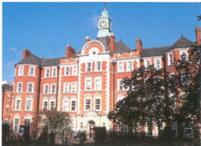
L'Hammersmith Hospital di Londra.

Recentemente a Bellinzona è stata creato un "Ospedale