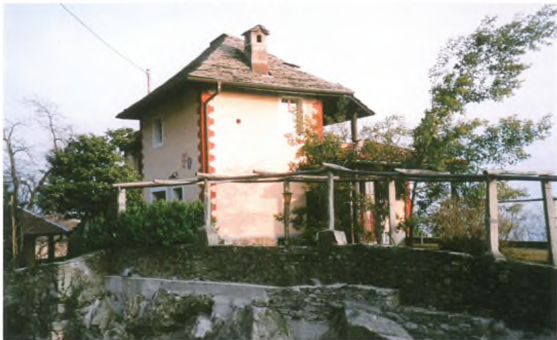
Casa Roccabella.

Questo è quanto abbiamo potuto raccogliere da rimembranze, annebbianti forse i nostri castelli in aria e, forse per questo, non siamo entrati nei dettagli riguardanti nomi e date. Comunque è roba del 1900.