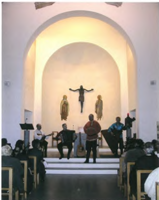
Baikal Kosaken.

Il concerto è stato assai applaudito dal numero pubblico.