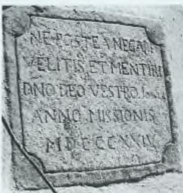
La versione italiana di quanto scritto sulla lapide che si trova sulla facciata della chiesa: "Affinché in seguito non vogliate mentire al Signore Dio Nostro - Anno della missione 1824"