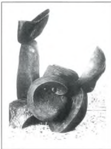
Un'opera di Gianmario Togni

Si è diplomato nel 1980 alla Scuola d'Arti e Mestieri di Bellinzona in qualità di elettrotecnico. Nel 1990 consegue la licenza di scultura all'Accademia di belle arti di Milano. Presenta regolarmente le sue opere in gallerie d'arte e in altri spazi.