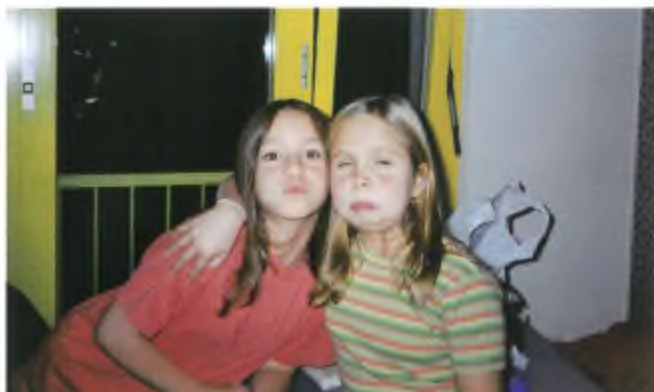
Che bello, si torna a casa!