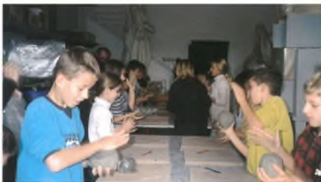
Mani in pasta.