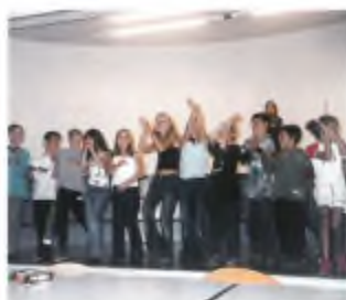
Ritmo e passione.