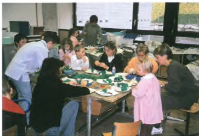
San Nicolao e ateliers: alcune delle attività organizzate dal gruppo

Il Comitato GGL augura Buone Feste a tutta la popolazione