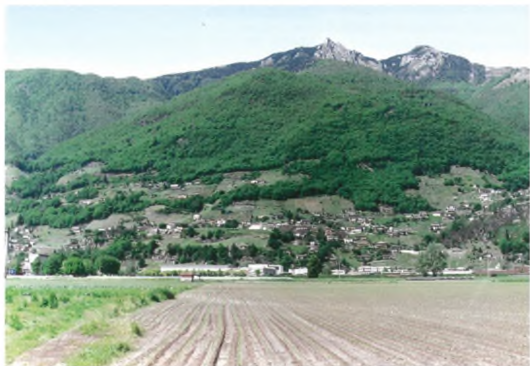
... e territorio al Piano.

Ma anche per le altre comunità convenute non dovrebbero rappresentare un ostacolo insormontabile il superamento di certi pregiudizi o anche oggettive divergenze di vedute, soprattutto economiche, perché di fatto l'aggregazione non costituirebbe altro che la riunificazione in un unico gremio politico delle componenti insediative formanti il mosaico territoriale della Valle Verzasca e del Piano.