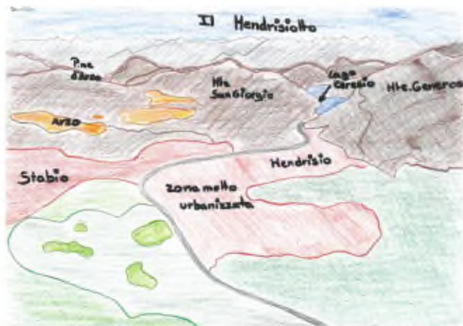
Schizzo della regione.