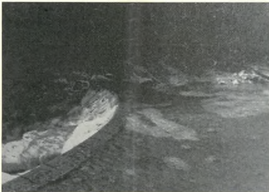
La diga di Lavertezzo dove si costruirà la nuova scala di monta.

Domenica, 28 gennaio si tenne a Gordola, nella sala del Consiglio comunale l'annuale assemblea dei soci della Società Verzaschese di Pesca e Acquicoltura.