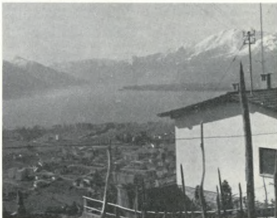
Le nuove costruzioni sorte laddove l'occhio godeva di un magnifico panorama.