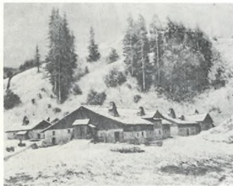
Fattoria del Giura in inverno