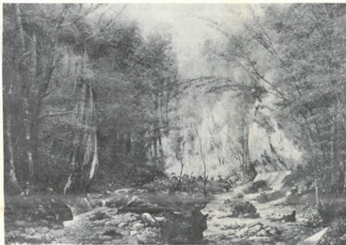
«Le gole del fiume Doubs alla Goule» (1884)

(N.d.R. - I pesci sono venuti a riva; uno è stato preso, ma purtroppo non dalla Pro Loco. E l'altro? ...)