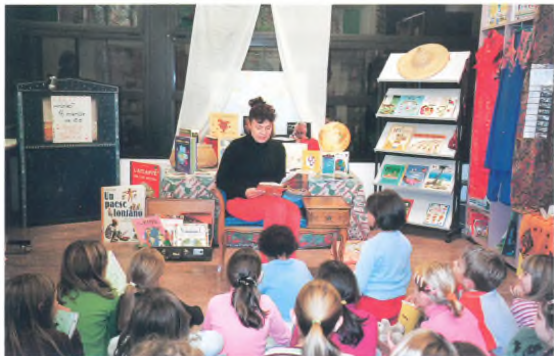
Madlena Perozzi racconta la Bulgaria.

testo di Gloria Matter