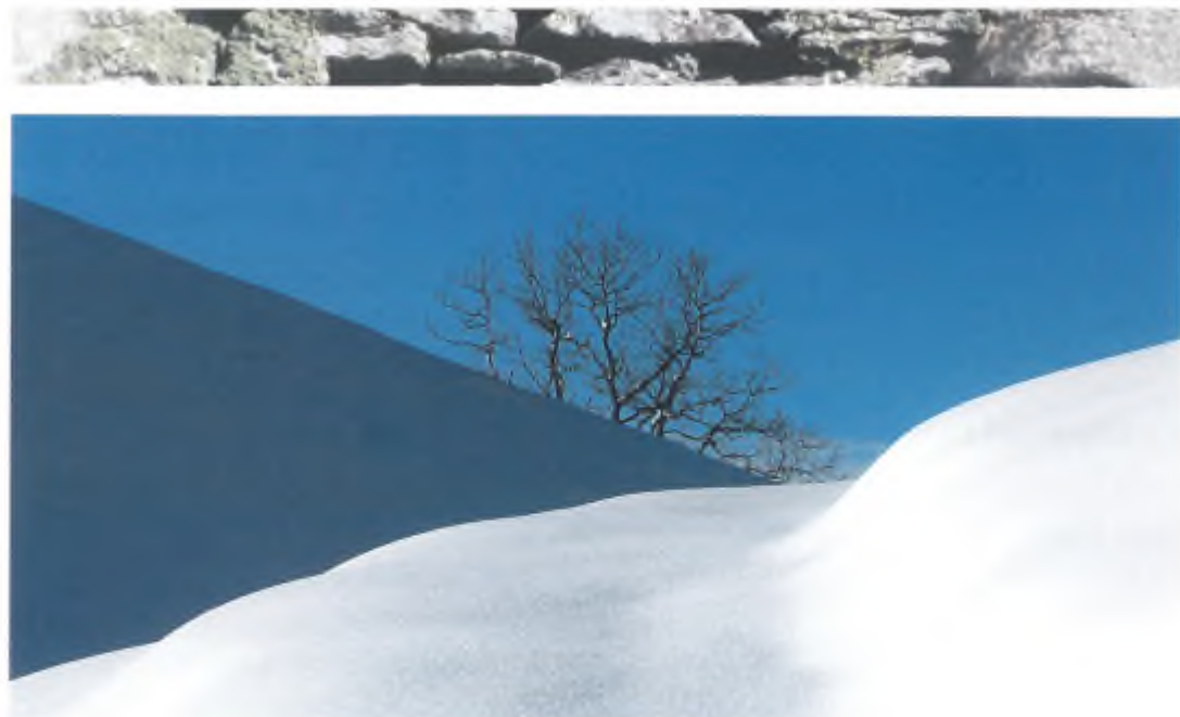
Prima neve sui monti Veloi.