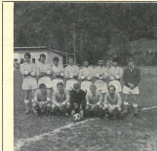
La forte compagine Brionese

prio torneo con la partecipazione del Gordola, Riarena, Vogorno ed ovviamente della squadra locale che giunta alla finalissima battendo il Vogorno conquistava l'ambita Challenge in mo-