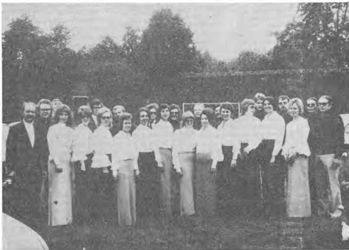
Il rinomatissimo coro germanico Juelicher Vocal Ensemble che si esibirà pure sulla piazza di Sonogno sabato, 28 luglio 1973, alle ore 16.00

Tutto quindi è pronto e non ci rimane che augurare a organizzatori e coristi uno strepitoso successo.