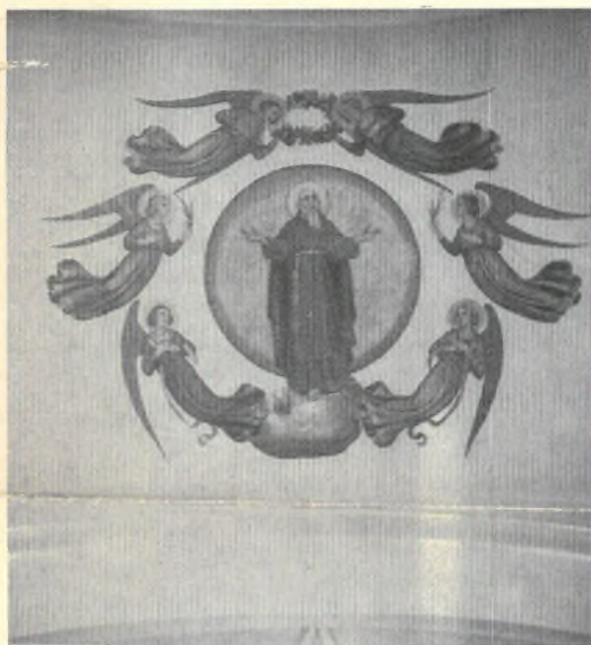
Particolare della navata maggiore ora restaurata